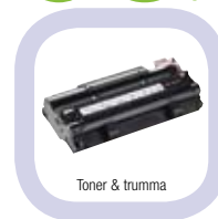
Toner &amp; trumma